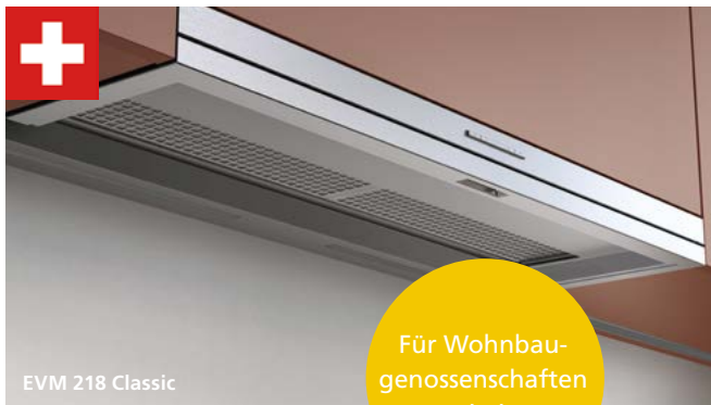
EVM 218 Classic