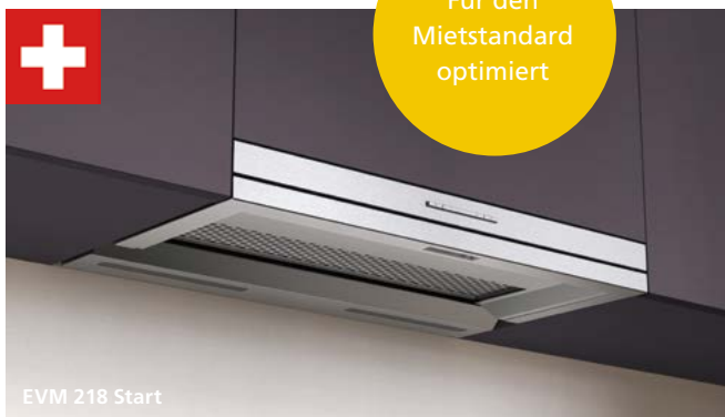
EVM 218 Start